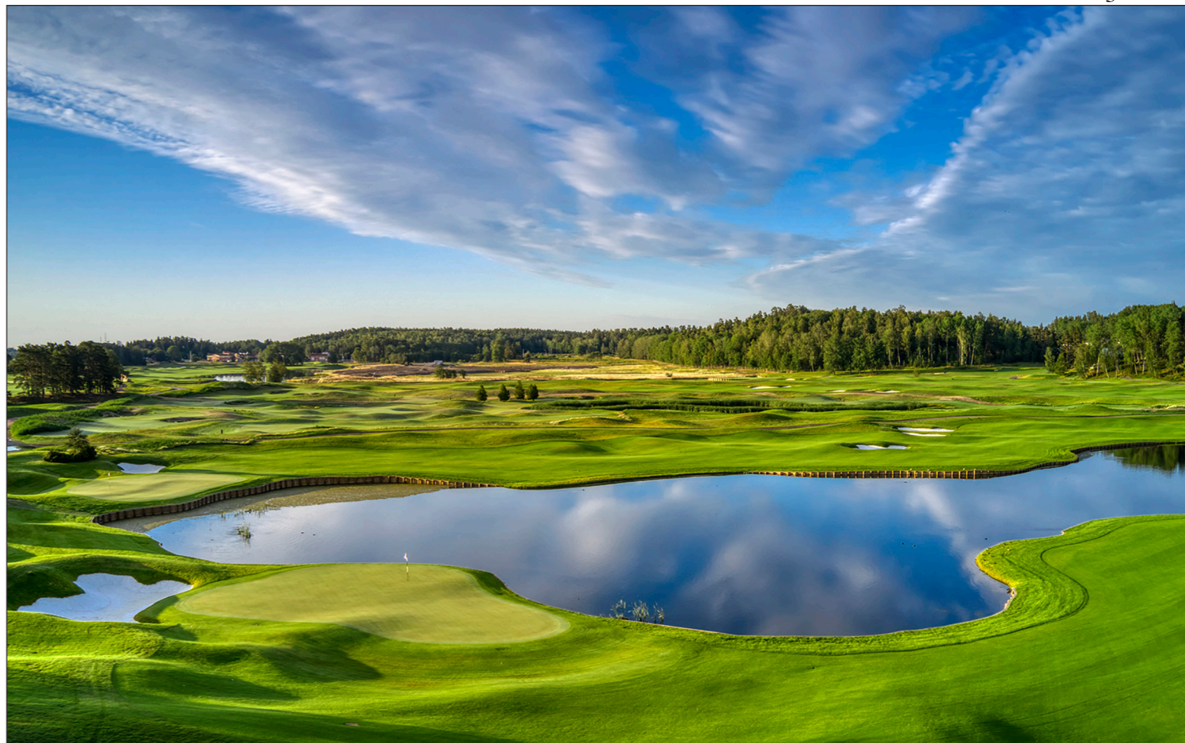
Inbjudande bana med böljande landskap och mycket vatten. Vilken utmaning för startfältet i 2020 års Press-SM!