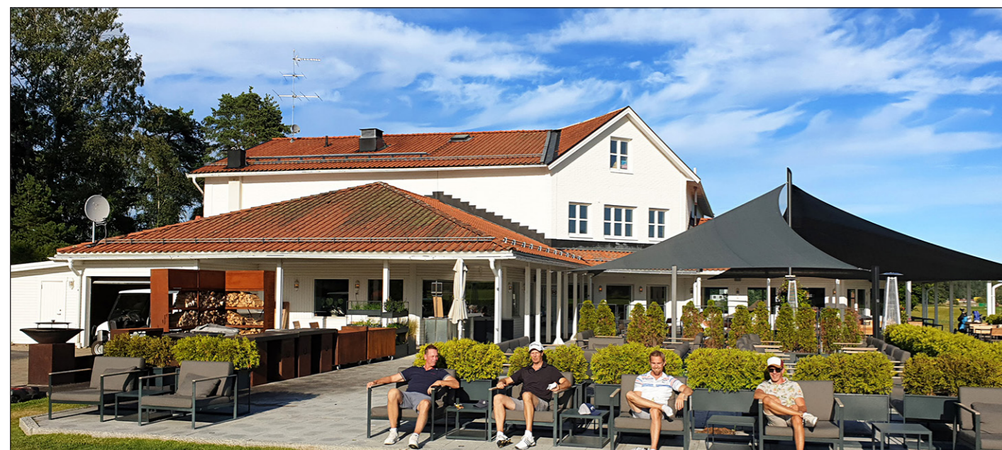
Klubbhuset på Österåkers GK. Här finns tid att slappa och att kaka på restaurang med namn efter vinnarscore...