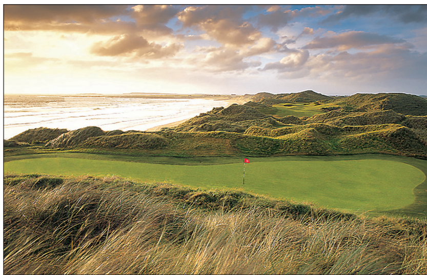
Studiebesök. Golfjournalisterna gjorde flera sådana under resan till Irland 2002, bland annat till nybyggda Doonbeg.

Det är då andra gången som cupen flyttas och alldeles säkert finns nu ett stort antal kepsar med feltryckta årtal för samlare att lägga beslag på. Lika exklusiva som den feltryckta kepsen med Ryder Cup 2005 Ireland blir de dock inte. Då var det ett mycket begränsat antal kepsar som hade tryckts upp med det