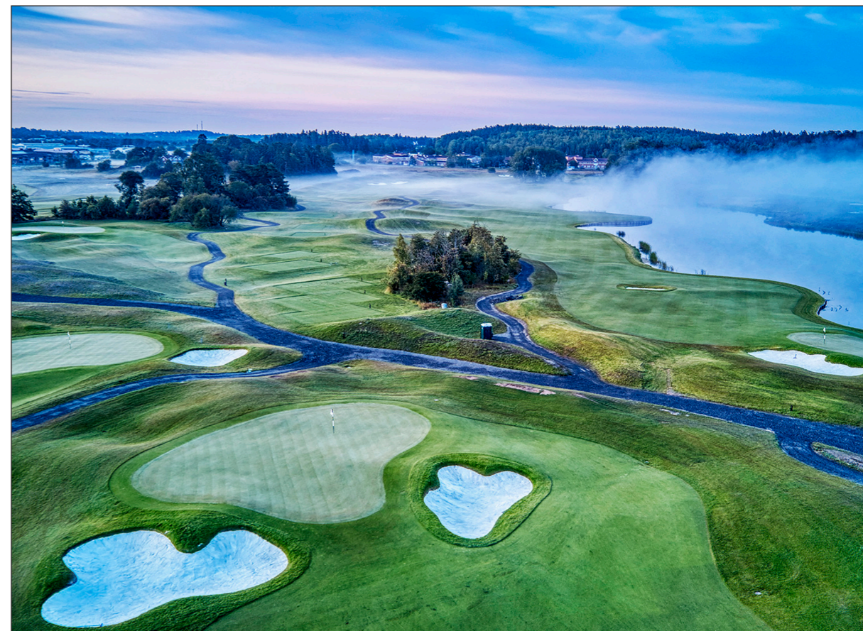
Detta är Henrik Stensons första designade bana. Den byggdes på två gamla banor.